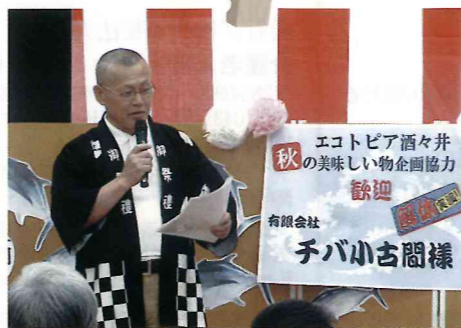
披露して下さるのは (有)チバ小古間の皆様です

みなさまから頂戴致しました書き損じのハガキや切手の寄付金で、この企画が実施できました。ご協力ありがとうございました。