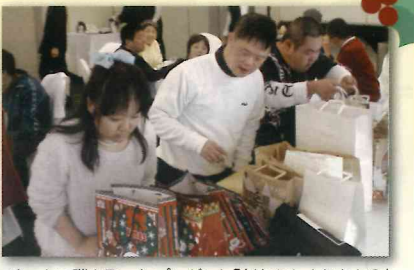
ゲームで勝ち取ったプレゼント「どれにしようかな?」

リサイクル作業や内職作業で忙しかった今年を振り返り「お疲れさま、来年も頑張りましょう!」と確かめ合いました。