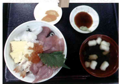
海鮮丼完成!! いただきます!