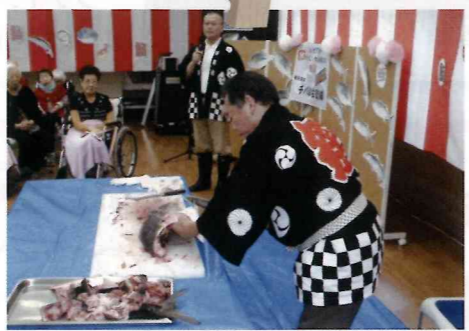
見事な包丁さばき!!