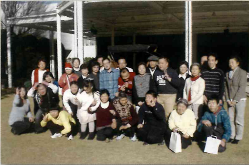
ホテルのお庭で集合写真「ハイ!チーズ」

平成27年12月19日「ワーク・かなえ クリスマス会」を、ラディソンホテル成田にて開催!