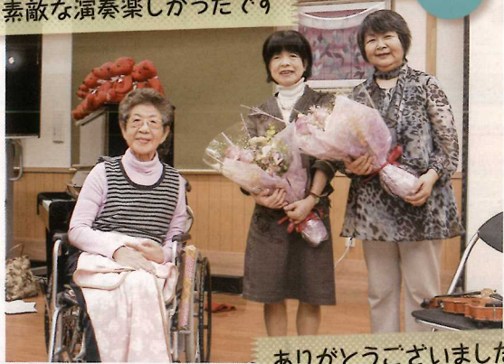
ありがとうございました