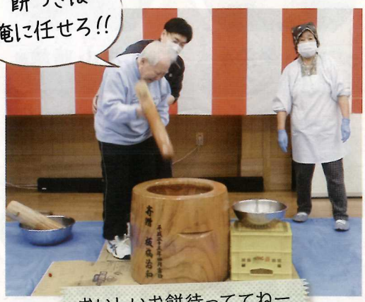
おいしいお餅待っててねー