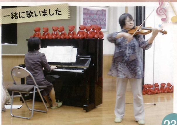
一緒に歌いました