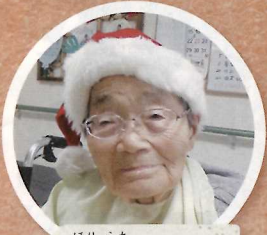
ほりうち 堀内タイ 様 (特養従来型)