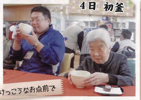
けっこうなお点前で