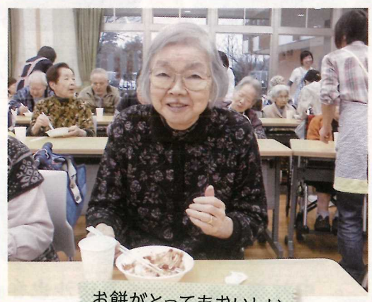
お餅がとってもおいしい