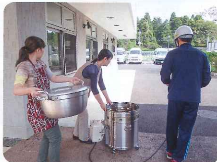
災害用調理器具「まかない君」