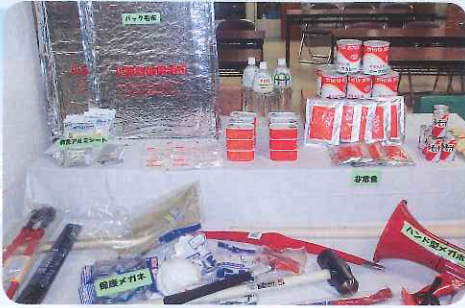
災害時備蓄用品他

平成28年4月14日に発生した熊本地震でお亡くなりになられた方々に謹んでお悔やみを申し上げるとともに、被災されました皆様に心からお見舞い申し上げます。当法人では平成23年の東日本大震災の教訓を基に大規模災害に備え、防災設備の整備や備蓄を行っています。今回はその一部をご紹介します。