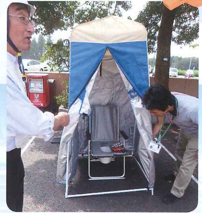
水不足の際も使用可能！ 「マンホールトイレ」