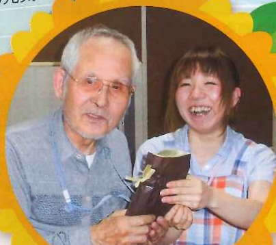
いつもありがとうございます

母の日には、今年も女性のご入居者に 真っ赤なカーネーションをプレゼント！ 花と共に笑顔も咲きました。