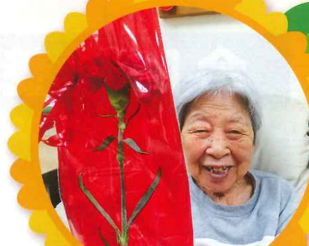
キレイなお花をありがとう！