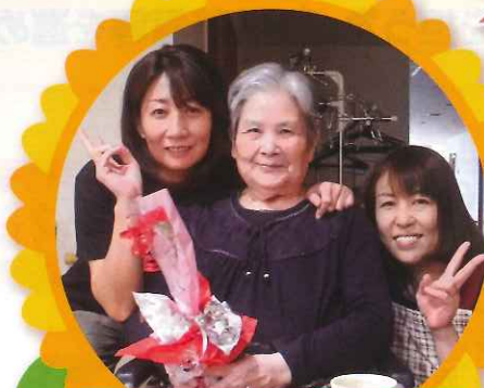
母の日カーネーションのプレゼント