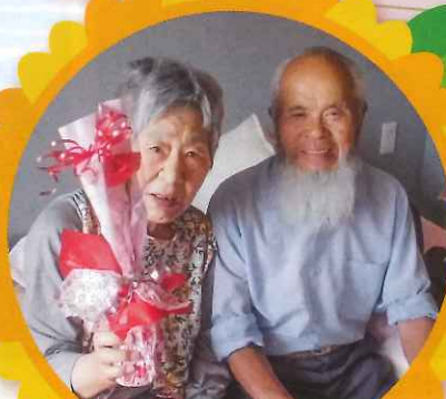
お母さんいつもありがとう