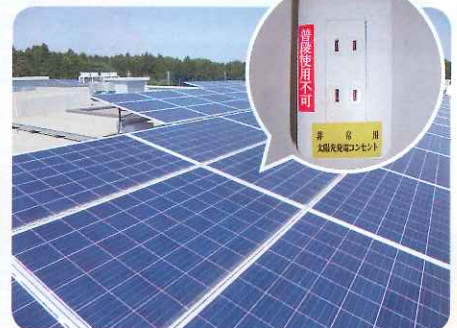
ソーラー発電設備で停電にも対応