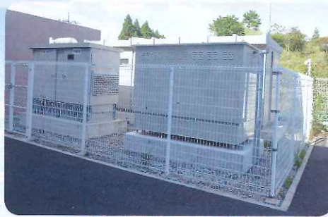
非常用燃料タンク&発電設備