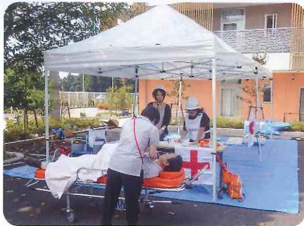
簡易救護所も設置します